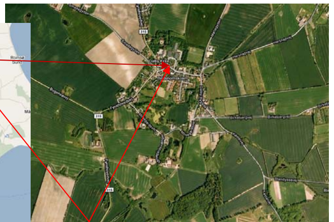
Hindsholmskolen Munkebo Idrætscenter